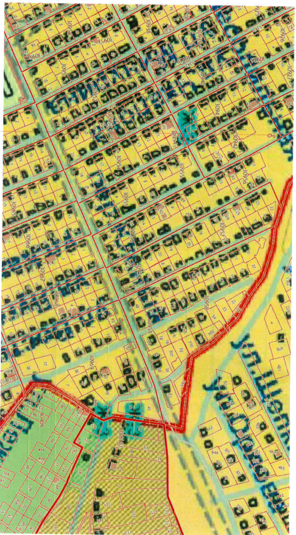
Схема размещения территории, на которую предполагается разработка на разработку проекта межевания территории в границах кадастрового квартала 57.25.0030958