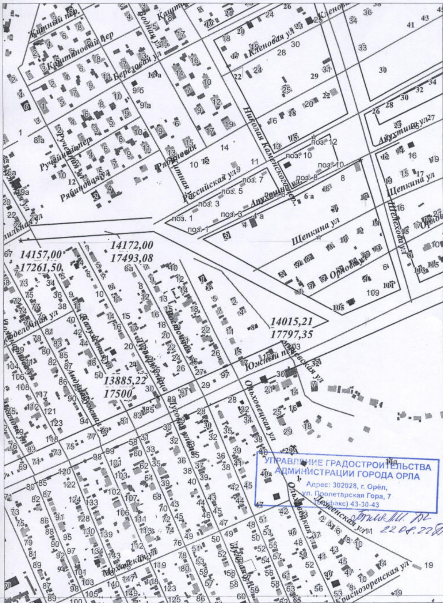
Схема координат углов поворотов красных линий в границах кадастрового квартала 57:25:0030958 в г. Орёл