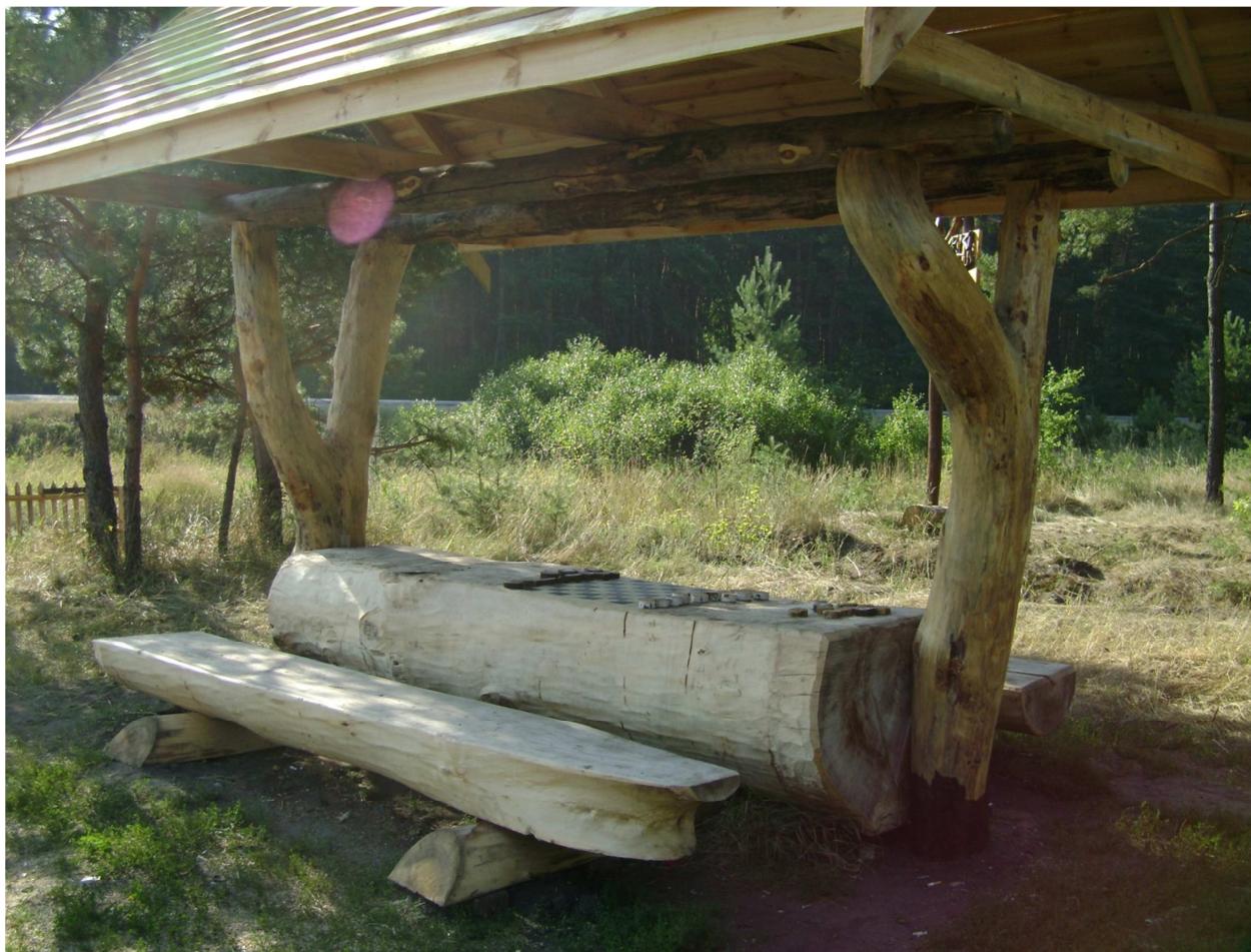
Место отдыха у дороги

красками, впечатление от них самое благоприятное и желающих отдохнуть под такими «грибками» всегда достаточно.